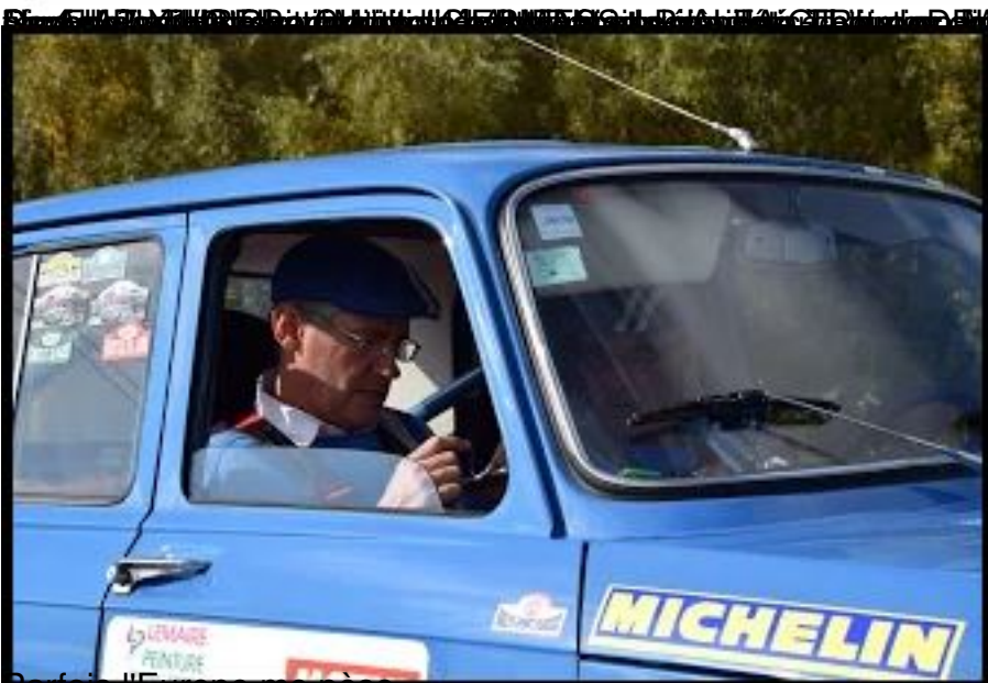
Parfois l'Europe me pèse...